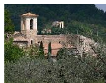
Abbazia di Sant'Angelo del 1058

... limes lanii , per via delle terme di acqua sulfurea (ancora presente), già note ai romani ;